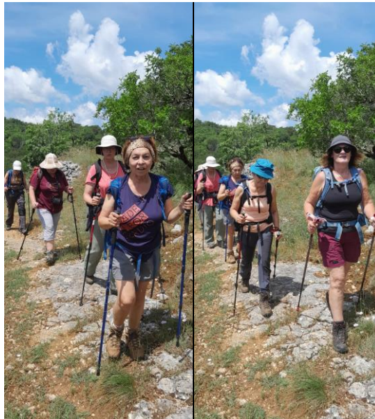
L'avant-garde des Cajaristes....

On prend le petit déjeuner, on récupère nos pique-nique et répartis en deux groupes, nous allons soit vers Cajarc, soit vers Assier.