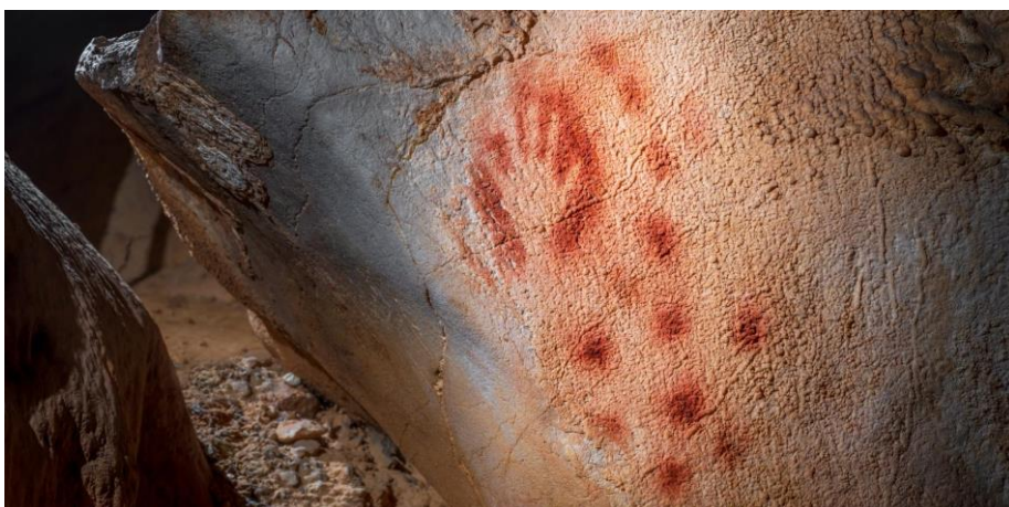
Quelques dessins de la grotte.