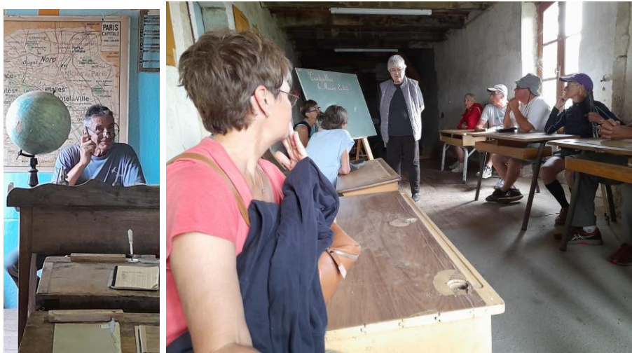
Le maitre d'école et ses élèves dignes représentants de Kairos

A travers un quartier du village on découvre successivement la maison du sémalier, le séchoir à châtaignes, l'étuve à pruneaux, le moulin à huile de noix et sa presse, la saboterie, la salle de classe du début du siècle et une exposition de jouets anciens, peintures, sculptures, etc.